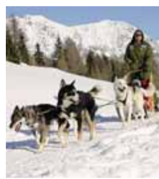
Escursione all'Husky Village

Sci, snowpark, ciaspole, ma anche passeggiate su slitte con i cani dell' Husky Village o giri a bordo di potenti automobili sul ghiaccioldromo. Un Capodanno insolito e originale quello che si può trascorrere a Livigno, poco più di 3 ore di auto da Bergamo. L' Husky Village ( www.huskyvillage.it ) di Arno, lungo la strada da Livigno a Bormio è aperto anche nei giorni di Capodanno: si possono prenotare escursioni con slitte trainate dai cani (31 dicembre e 1 gennaio); le escursioni possono durare